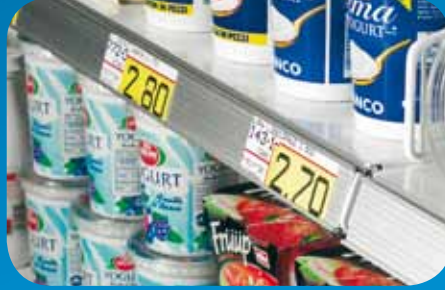
Portaprezzi in alluminio e plastica. Price holders in aluminum and plastic. Porte-prix en aluminium et en plastique. Alu- und Kunststoff- Preisschienen. Porta precios de aluminio y plástico. Держатели ценников из алюминия и пластмассы.