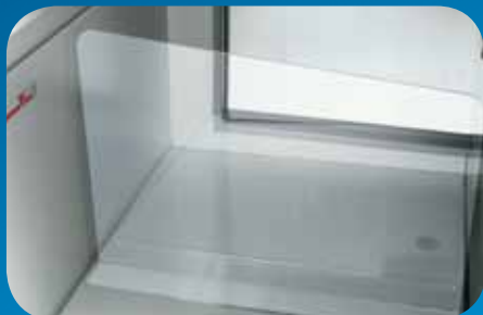
Spondine e divisori in filo. Wire risers and partitions. Balconnets et séparateurs en fil. Frontscheibe und Gittertrennwände. Bordes y tabiques de alambre. Бортики и делители из проволоки.

Пристенная горка «Argus Doors» с положительной температурой, благодаря своей небольшой высоте гарантирует обширный объем экспозиционной площади и отличную видимость выложенных продуктов. Холодильное оборудование с дверцами из стеклопакетов представляет собой ответ на новое растущее требование рынка, касающееся торгового оборудования, обеспечивающего существенное сокращение потребления энергии, в сочетании с улучшением эксплуатационных показателей хранения выложенных продуктов. Наличие стеклянных дверец способствует также улучшению комфорта покупателей, достигнутого благодаря сокращению ощущения холода при прохождении вдоль торгового ряда. Кроме того возможность «компоновки в линию» с другими моделями горок «Argus» усиливает гибкость ее использования и позволяет дифференцировать экспозиционную типологию.