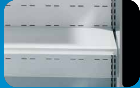
Ripiano aggiuntivo - Illuminazione ripiani. Extra shelf - Shelf illumination. Tablette supplémentaire - Éclairage étagères. Zusätzliche Etage - Auslagenbeleuchtung. Estante adicional - Iluminación estantes. Дополнительная полка - Освещение полок.